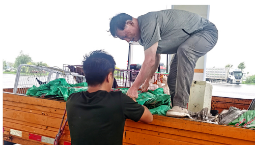
途中冒雨为禽畜搭建遮挡雨棚。