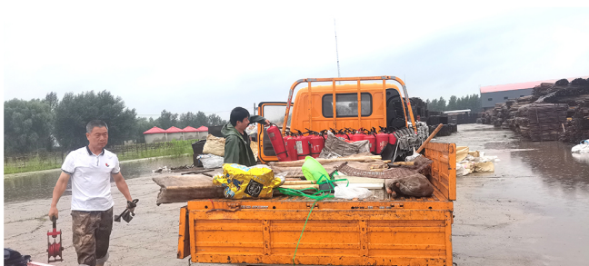
员工在双辽基地卸货