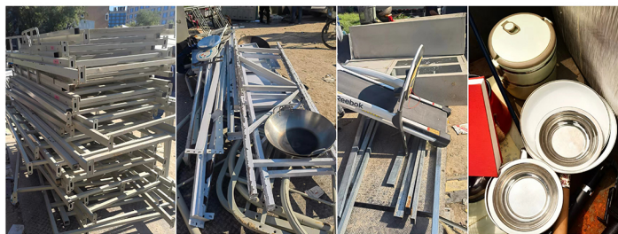
正在回收的旧物多种多样

天无弃物，垃圾是放错了地方的资源，利用旧物就是节能减排的善行善举，从自己做起，优待旧物，节约资源，保护环境，为子孙留下碧水蓝天。