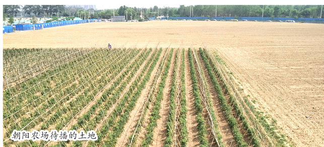
朝阳农场待播的土地