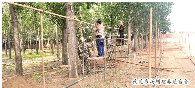
南范农场增建养殖畜舍