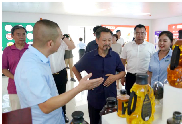
捐赠仪式结束后，董主席到阜平县企业参观考察。