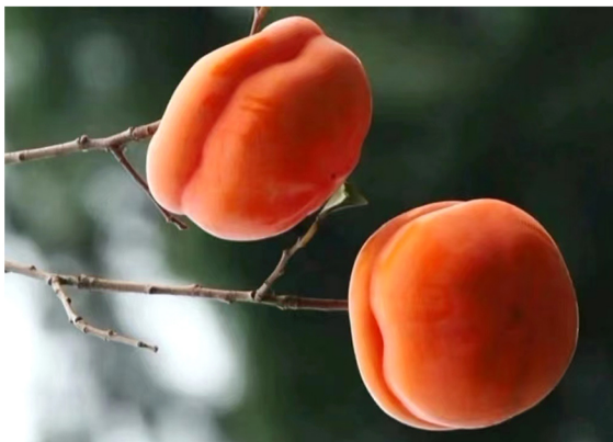
上方山基地的大柿子红红火火，团团圆圆，多么诱人！

在此，我由衷地感谢领导对我们的关怀爱护，我要继续坚守在自己的岗位上，为公司做出更大的贡献。同时大力宣传集团的绿色食品，让更多的人受益。