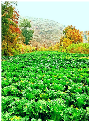
上方山基地大白菜长势喜人, 丰收在望。