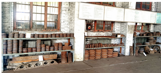
马矿组织员工把翻砂铸造车间、电修车间里可用的废旧原料集中一起管理。摆上货架,登记标签,便于修旧利废。